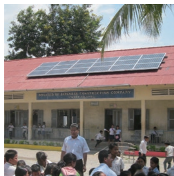
カンボジアの小学校に校舎と太陽光発電を寄贈

2019年7月には、地銀20行と協働で、中堅中小企業向けの新たなSDGs推進モデルとなる「CoCoLo(ココロ)プロジェクト」を開始。金融機関は、太陽光発電や省エネに関心のある企業を同社に紹介し、設備費用を融資するESG金融を行う。企業は太陽光発電設備で発電した電力を自家消費することで電力使用量を削減。ウエストグループは、企業からCO2削減効果を譲り受け、国が認証するJ-クレジット制度を利用して換金し、子育て支援や植林事業に寄附をする。